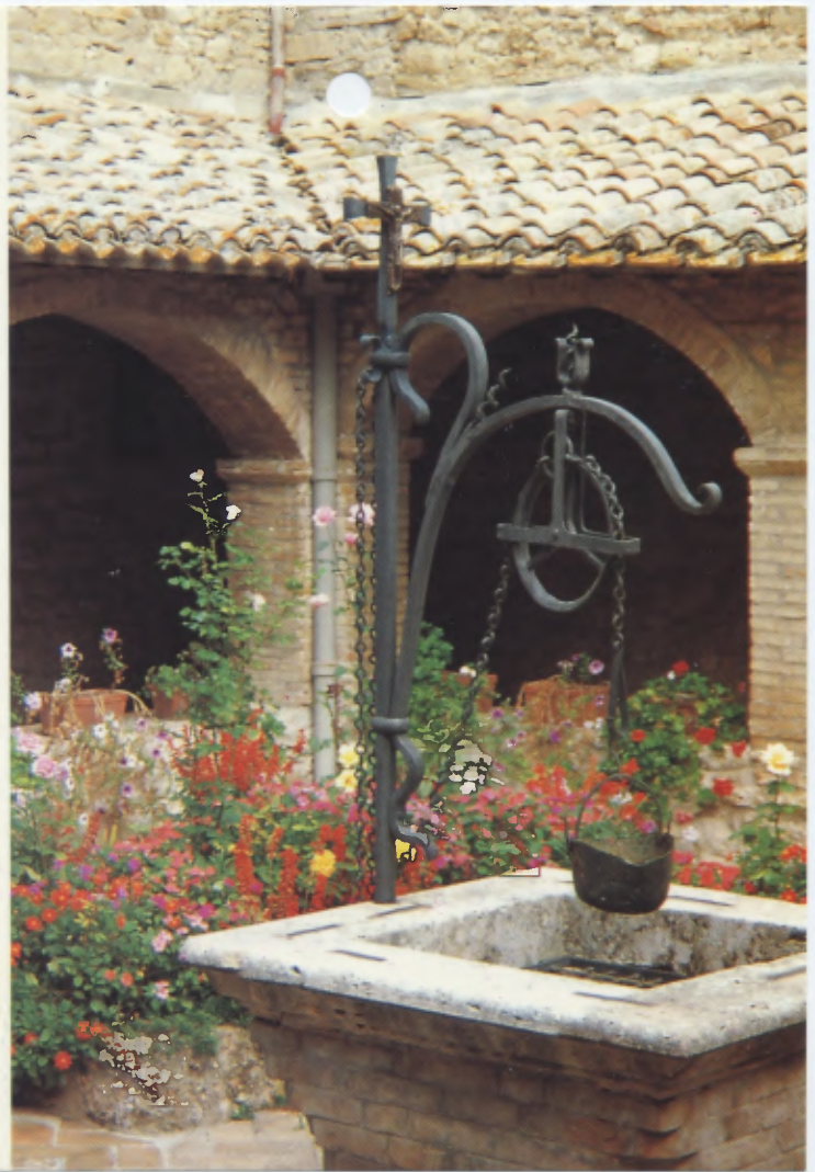
Assisi - Chiostro S. Damiano