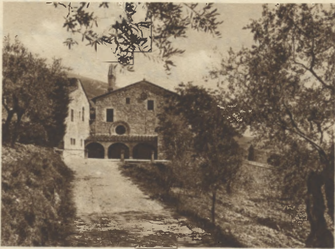
ASSISI - Santuario di S. Damiano : 26x1 1993